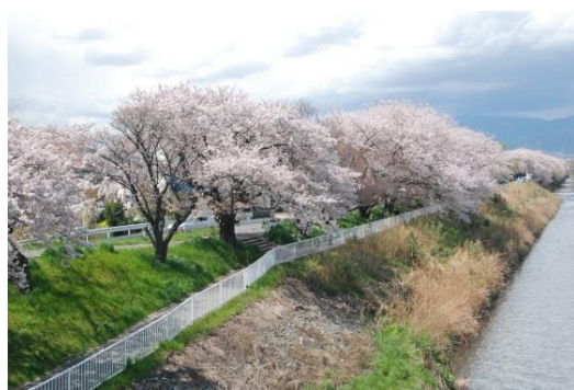
(花水川 桜全景 満開でした)