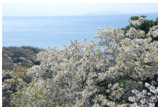
(大島桜とはるか遠くに大島)