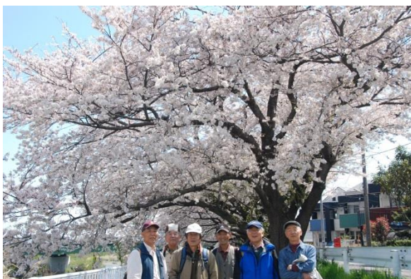
(花水川 桜堤を半分歩いて居酒屋へ)